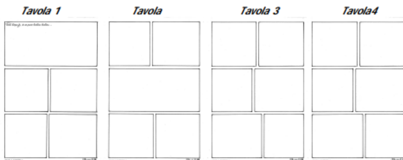
Fac simile delle tavole da utilizzare per la partecipazione al contest.